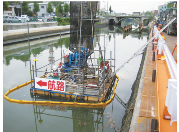
堀川 船上ボーリング調査